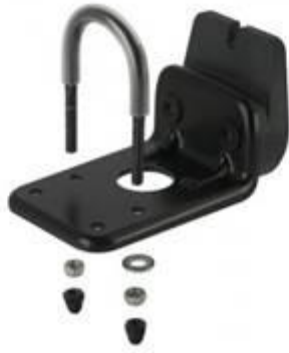
Voorbeeld Adapter BoBike